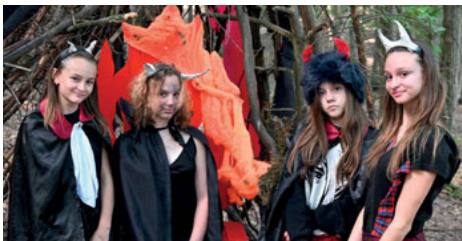
Pohádková přehrada Všemina (str. 8)