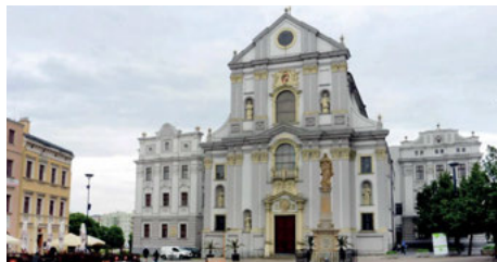
Zájezd na Opavsko (str. 13)