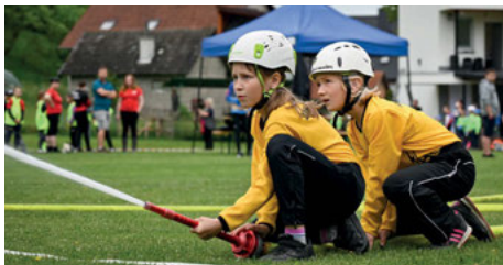
Hasiči Všemina (str. 10 - 11)