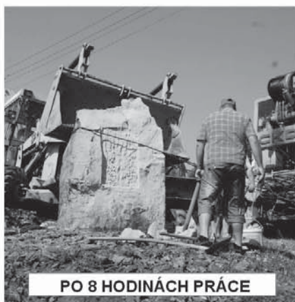
PO 8 HODINÁCH PRÁCE