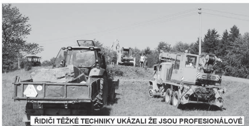
ŘIDIČI TĚŽKÉ TECHNIKY UKÁZALI ŽE JSOU PROFESIONÁLOVÉ