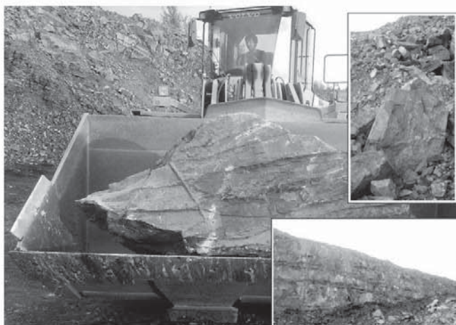
KÁMEN V DOLE V JAKUBČOVICÍCH