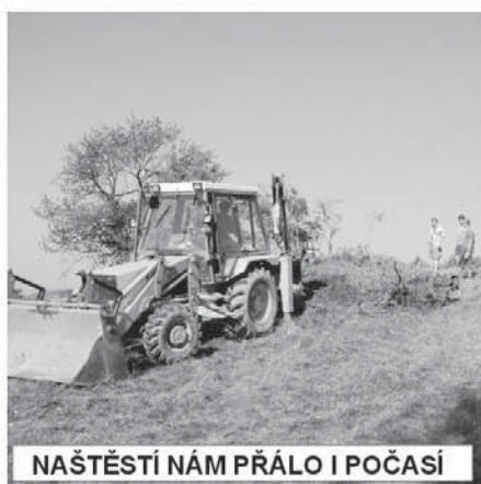
NAŠTĚSTÍ NÁM PŘÁLO I POČASÍ