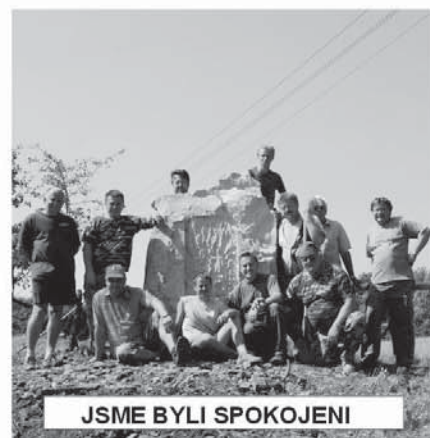
JSME BYLI SPOKOJENI