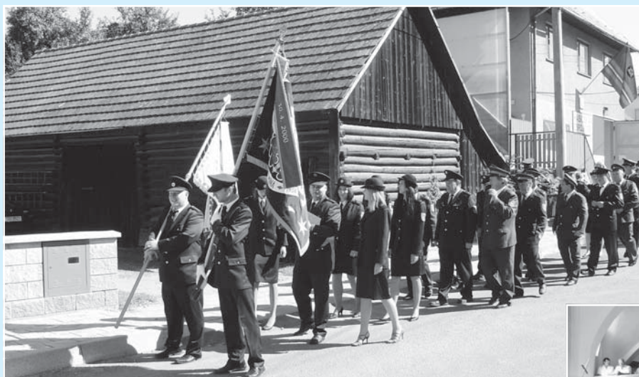
Dne 21. srpna 2011 jsme oslavili 75. výročí založení Sboru dobrovolných hasičů ve Všemíně.