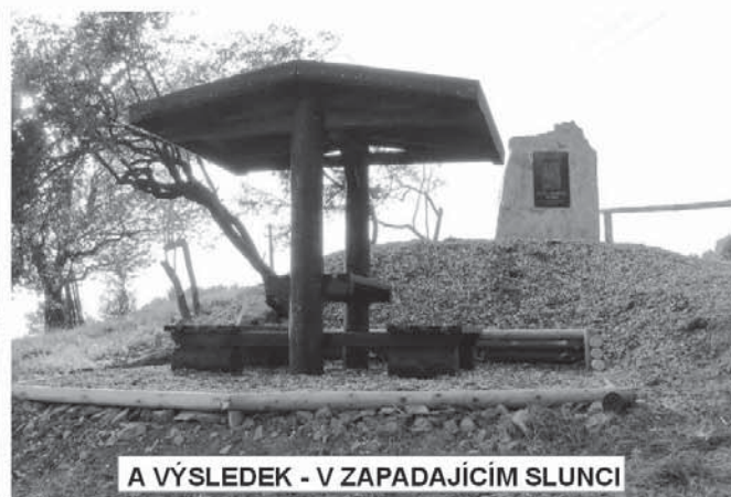
A VÝSLEDEK - V ZAPADAJÍCÍM SLUNCI