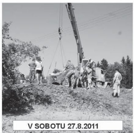
V SOBOTU 27.8.2011