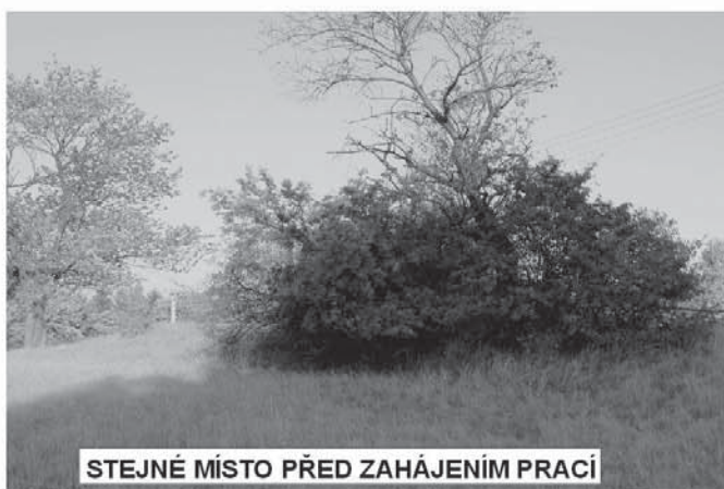
STEJNÉ MÍSTO PŘED ZAHÁJENÍM PRACÍ