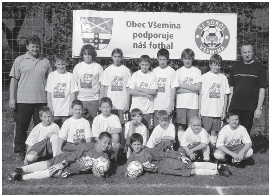
Mužstvo žáků – sezóna 2010/2011 v nových dresech

sezóny dorost nepřihlašovat. Zůstávajícím mladým hráčům se dala příležitost probouvat se do úzkého kádrů mužů.