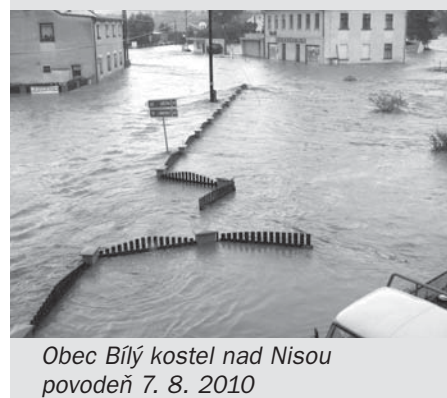
Obec Bílý kostel nad Nisou povodeň 7. 8. 2010