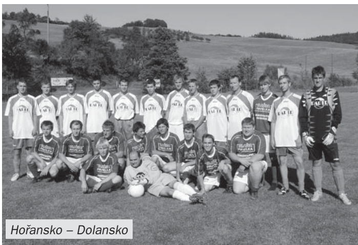
Hořansko - Dolansko

Náš A-tým se v závěru jara potýkal s nedostatkem fotbalistů, a proto by právě tito hráči měli využít řady naší vlajkové lodi.