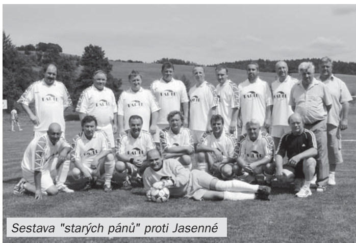
Sestava "starých pánů" proti Jasenné