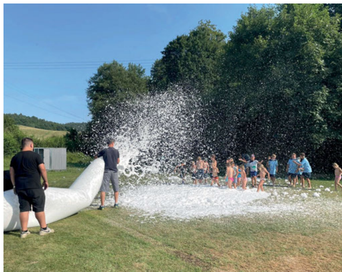
Výroba pěny na hřišti TJ Sokol Všemina.

V rámci spolupráce mezi spolky pak zásahová jednotka dne zajistila 20. 7. 2024 výrobu pěny pro malé a mladé fotbalisty na hřišti TJ Sokol Všemina. Dále v rámci 54. ročníku Barum Rallye zásahová jednotka ve dnech 17. - 18. 8. 2024 zajišťovala požární bezpečnost v rámci uzavřené tankovací zóny pro soutěžní vozy v areálu DF Partner v Neubuzi.