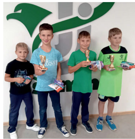
Turnaj stolní tenis mládež.

a Dolanska, ale Severu proti Jihu, kdy hranici tvoří Všeminka a není tak sporu, jestli je polovina obce kostel, obecní úřad nebo třeba trafostanice u Zerzanů. V klání byli o gól úspěšnější Jižané. Program byl položen pochodem turistů kolem Všeminy a individuálními sportovními soutěžemi dětí.