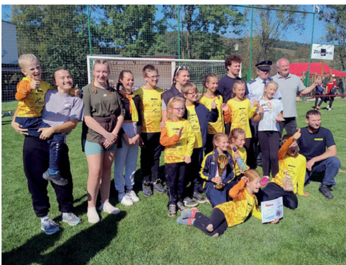
3. místo družstva mladších žáků na soutěži „O pohár starosty obce Všemina“, sobota 21. 9.

Další významnou akcí, která proběhla v sobotu 21. 9. 2024 byl další ročník Pohárové soutěže v požárním sportu O pohár starosty obce Všemina pro sbory 11. okrsku a pozvané hostující týmy. Akce proběhla po uzavěrci zpravodaje, proto bližší informace přineseme v příštím čísle. Soutěž byla rozdělena na dvě části: dopolední soutěže družstev mladších a starších žáků (od 9 hod.) a odpolední soutěže družstev žen a mužů od 13 hod. Příjemné posezení po soutěži pak pokračovalo do pozdních večerních hodin. Rádi bychom v zahájené tradici zářijové „pohárovky“ spojené s hasičským odpolednem pokračovali i v dalších letech. Děkujeme za poskytnutí zázemí a prostor TJ Sokol Všemina a Obci Všemina za záštitu celé akce.