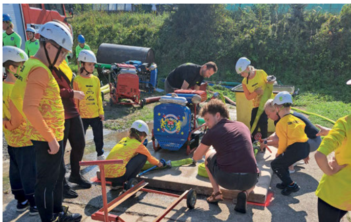
Příprava základny družstva žáků na soutěži v Neubuzi.

Družstvo mužů v letošní sezoně požárního sportu bylo velmi aktivní. Náš tým se pravidelně účastní všech soutěží Zlínské ligy v požárním sportu (ZLPS) a Jihovalešské ligy nočních soutěží (JLNS) , k tomu se účastnili i řady dalších pohárových soutěží – celkem jich bylo k datu uzávěrky 26! Někteří víkend zvládli navštívit i 3 soutěže. Vzhledem k tomu, že ke dni uzávěrky zpravodaje jsou ligy ukončeny, níže je ucelený přehled výsled-