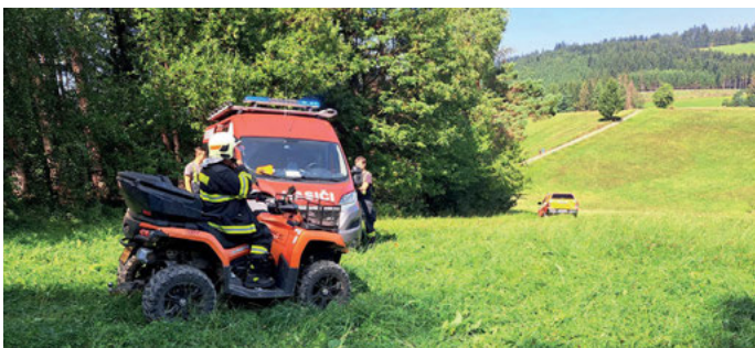
Technická pomoc s transportem pacienta.

V rámci spolupráce mezi spolky pak zásahová jednotka dne zajistila 20. 7. 2024 výrobu pěny pro malé a mladé fotbalisty na hřišti TJ Sokol Všemina. Dále v rámci 54. ročníku Barum Rallye zásahová jednotka ve dnech 17. - 18. 8. 2024 zajišťovala požární bezpečnost v rámci uzavřené tankovací zóny pro soutěžní vozy v areálu DF Partner v Neubuzi.