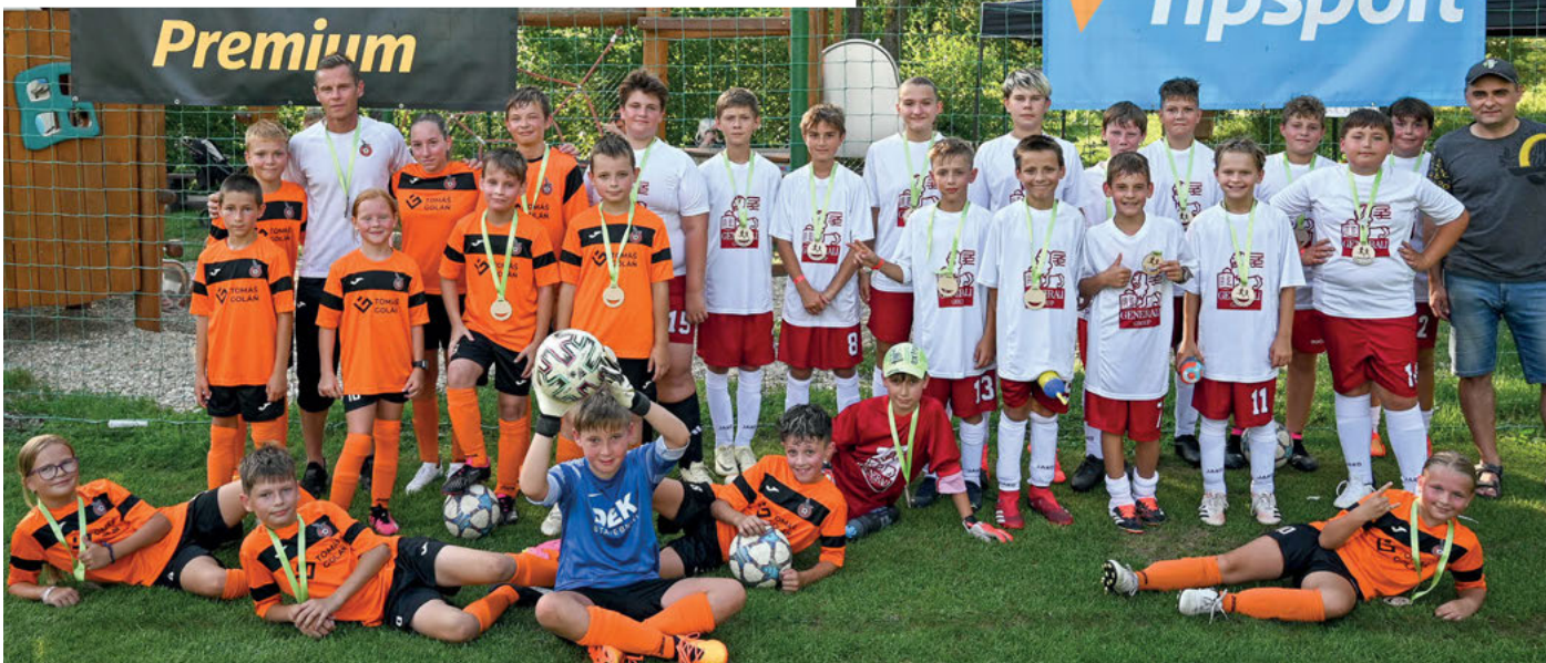
Mladší žáci - Všemina sportuje.