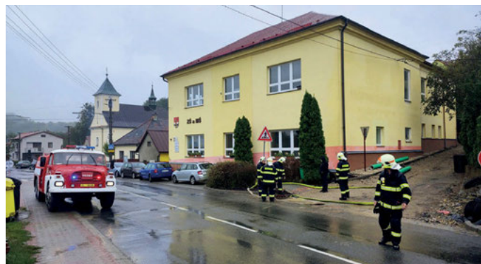
Naši hasiči při čerpání spodní vody ze sklepa budovy ZŠ a MŠ.

Povodňová komise byla v nepřetržitém kontaktu prostřednictvím aplikace WhatsApp a v hodinových intervalech jsme kontrolovali a hodnotili situaci v celém katastru obce. Ráno 15. září byl vyhlášen druhý stupeň povodňové aktivity (2. SPA). Tento stupeň