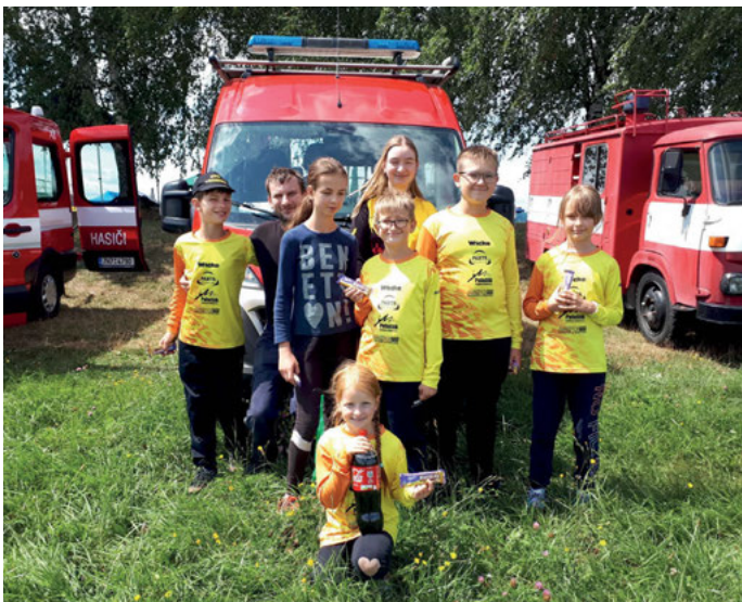
Družstvo žáků při soutěži na Březové.

První zářijový víkend 2. - 3. 9. se naši zástupci účastnili na pozvání družebního sboru Hasičského víkendu ve Strahovicích spolu s účastí spolu s účastí v rámci soutěže požárního sportu. V neděli 15. 9. 2024 se konala každoroční pamětní mše svatá za živé a zemřelé členy našeho sboru a jejich rodiny. Po mši svaté jsme strávili příjemné společné dopoledne besedováním na zbrojnici.