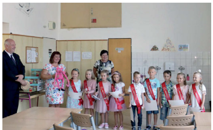
Pasování prvňáčků, 2. září 2024.