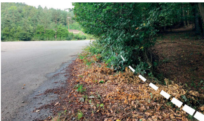
Léta neudržovaný porost „ukrajuje“ šířku komunikace.