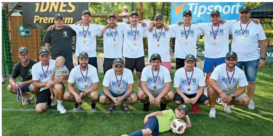
Muži s medailemi za vítěze IV. třídy.