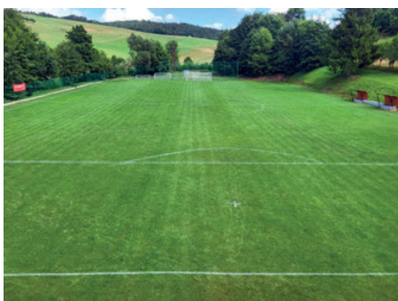
Hřiště po údržbě.

Letní období u sportovců nebylo okurkovým, jak by se mohlo zdát. Po realizaci závlahového systému jsme se učili starat se o fotbalové hřiště, které je dostatečně zásobeno vodou. Znamená to zvýšené nároky na údržbu, ať už vlastní sečení, kdy tráva roste a zelená se, ale i o samotnou plochu, kdy se projevují další různé nedostatky v kvalitě trávníku, které se snažíme operativně odstranit. Nejvíce o tom může říct Milan Gajdošík, který se stará vzorně o sečení a výsledky může posoudit každý návštěvník hřiště sám. Díky podpoře obce a dotacím Zlínského kraje se podařilo opět posunout náš sportovní areál na vyšší úroveň. Dlouhodobým cílem je fotbal více zpopularizovat u veřejnosti, aby měl ideální podmínky se dále u nás rozvíjet, a to především rozšířením členské základny v řadách mládeže.