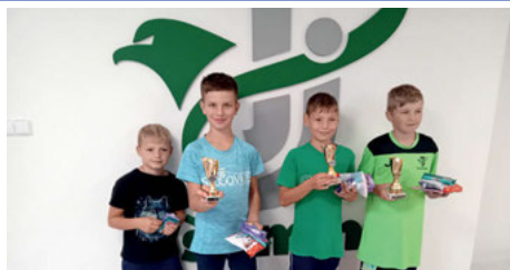
Sokol Všemina (str. 14 - 16)