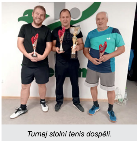
Turnaj stolní tenis dospělí.

Od konce srpna běží mistrovské soutěže. Do nich jsme přihlásili rekordní čtyři týmy. Muži jako postoupivší celek do III. třídy v béčku, tzv. valašské skupině. Poznáváme tak pro nás méně známá místa a hřiště, ale o to může být soutěž pro nás zajímavější. Mladší žáci, ročníky 2012 a 2013 pokračují beze změny. Těm starším jsme dali možnost navázat v žácích v Liptále, se kterým chceme v mládežnických kategoriích i do budoucna rozvíjet dobře započatou spolupráci. Starší a mladší příprava hrají svoje utkání současně s cílem zabudovat do Sokolu i ty nejmladší.