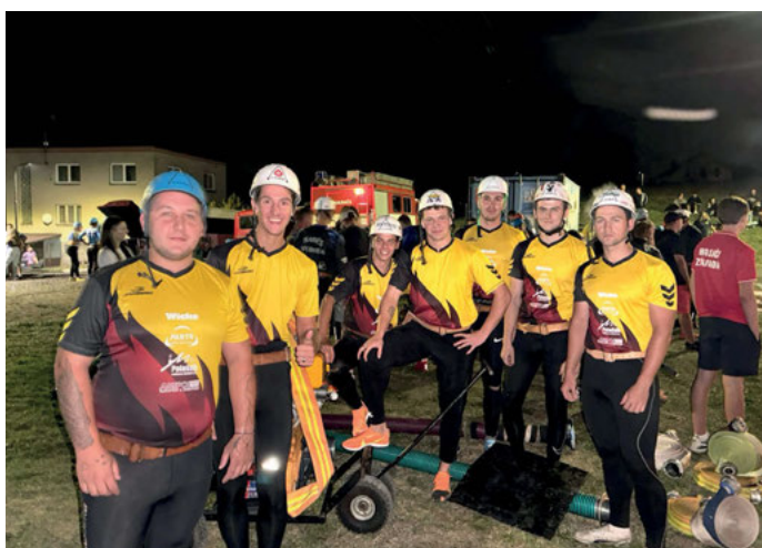
Družstvo mužů Všemina.

Žákovská družstva se během léta účastnila celkem 4 pohárových soutěží: Hrobice 6. 7., Březová 3. 8., Neubuz 31. 8. V rámci Grand Prix 11. okrsku nás čeká poslední závod 21. 9. 2024 ve Všemíně (více o akci níže), jehož výsledky budou známy až po vydání zpravodaje a celkový přehled přineseme v příštím čísle. Rovněž máme za sebou účast i v tradiční pohárové soutěži družstev nad 35 let na Březové v sobotu 3. 8. 2024 , kde si na svá soutěžní léta zavzpomínali naši matadoři a ukázali, že útok pořád umí a brali pěkné 4. místo. Těmito řádky by naši sportující hasiči chtěli poděkovat sboru i obci za podporu - především těm, kteří si na podporu našich týmů udělali čas a pomohli s dopravou, organizací, tréninkem, servisem a údržbou techniky a cvičišť. Všem našim závodníkům děkujeme za účast na soutěžích a za dobrou reprezentaci našeho sboru.