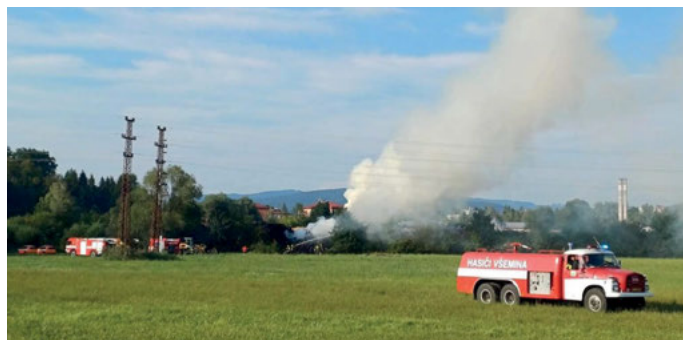
Zásah na pile ve Slušovicích.

Zejména zásah při požáru skladu dřeva u pily ve Slušovicích byl poměrně rozsáhlý, kdy byl vyhlášen 2. stupeň poplachu a na místě zasahovalo 9 jednotek profesionálních a dobrovolných sborů: CHS Zlín, CHS Uherské Hradiště, CHS Holešov, JSDHO Bratřejov, JSDHO Kašava, JSDHO Slušovice, JSDHO Trnava, JSDHO Vizovice a JSDHO Všemina.