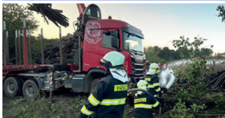
Naši hasiči pomáhají, kde je potřeba (str. 8 - 10)