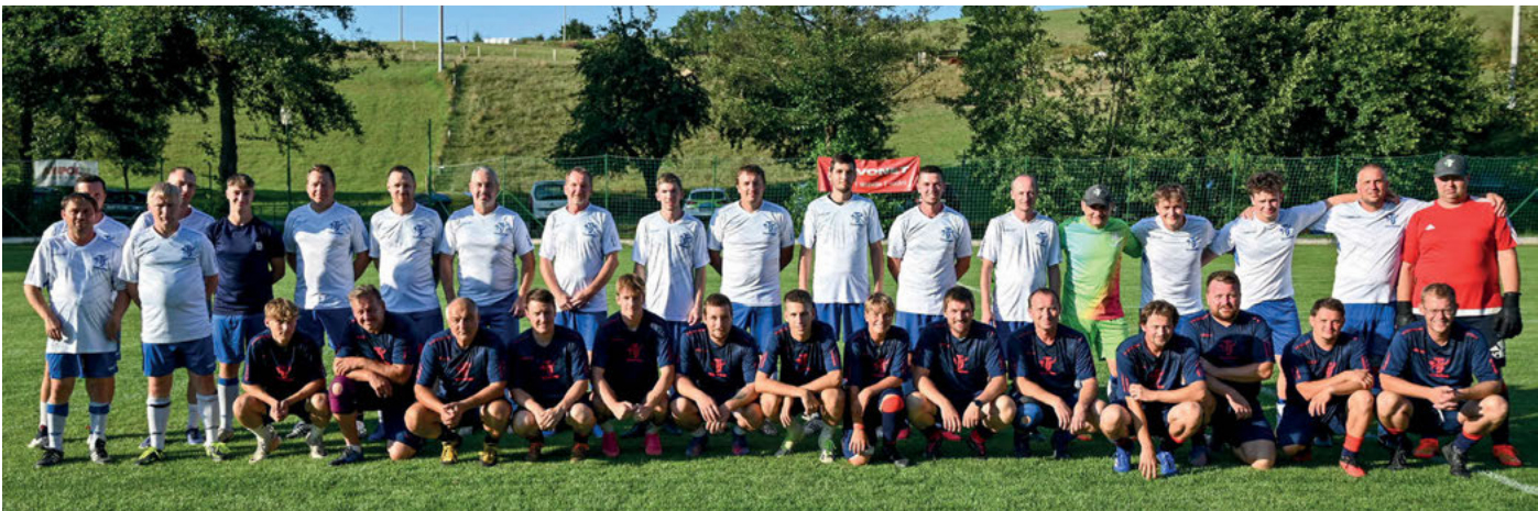
Sever proti Jihu.