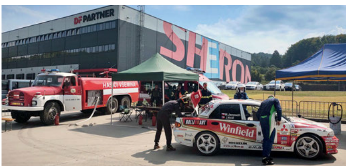
Tankovací zóna při Barum Rallye.