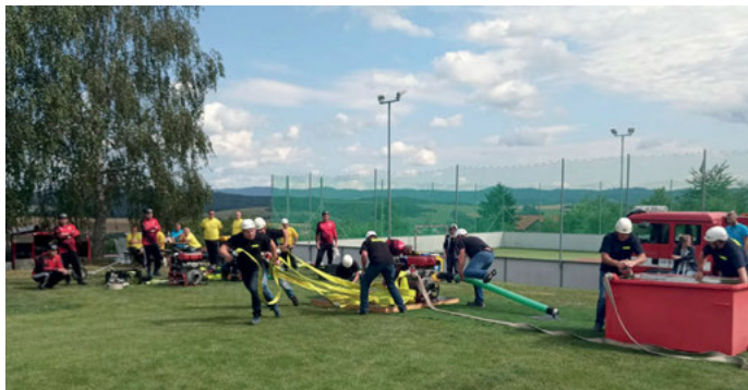
Útok družstva mužů nad 35 let při pohárovce na Březové.

ků. Vybíráme ze zajímavých výsledků: například v Prlově 14. 7. s vynikajícími časy sestřiku 14:28 a 14:45 (na 2B hadice) brali první místo! Výsledky ukazují na opravdu špičkovou úroveň, která v rámci ligových soutěží aktuálně panuje. Po skončení sezony tak náš tým celkově skončil na 4. místě v rámci Zlínské ligy v požárním sportu (ZLPS) a na 7. místě v rámci Jihovalešské ligy nočních soutěží (JLNS). Gratulujeme! O našem sboru tak je slyšet v rámci požárního sportu na krajské úrovni. Děkujeme našim borcům za reprezentaci sboru a obce a všem, kteří jim v rámci soutěže a příprav pomáhají.