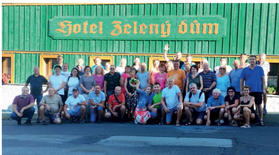
Zájezd turisté 2024.