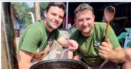
Všeminský kotlík slavil úspěch (str. 12 - 13)